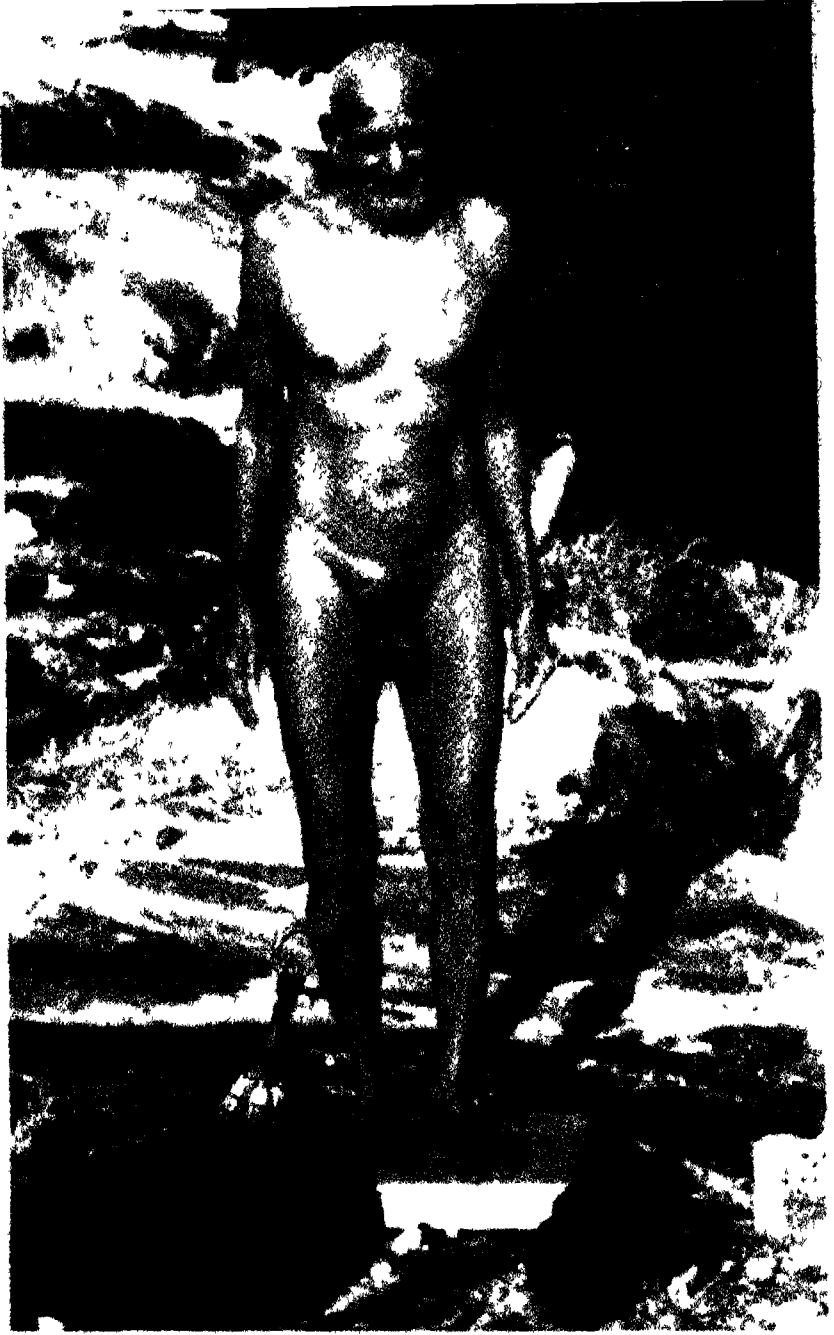
आचार्य विमलसागरजी महाराज